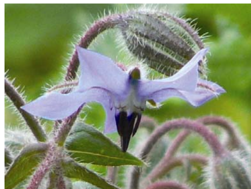
Borage / Komkommerkruid